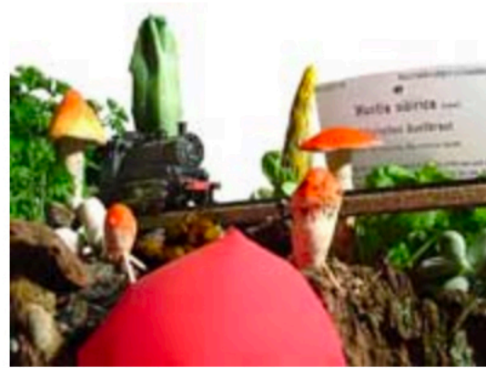
Biotope – Neues vom Institut für Hybristik und empirische Schwellkörperforschung